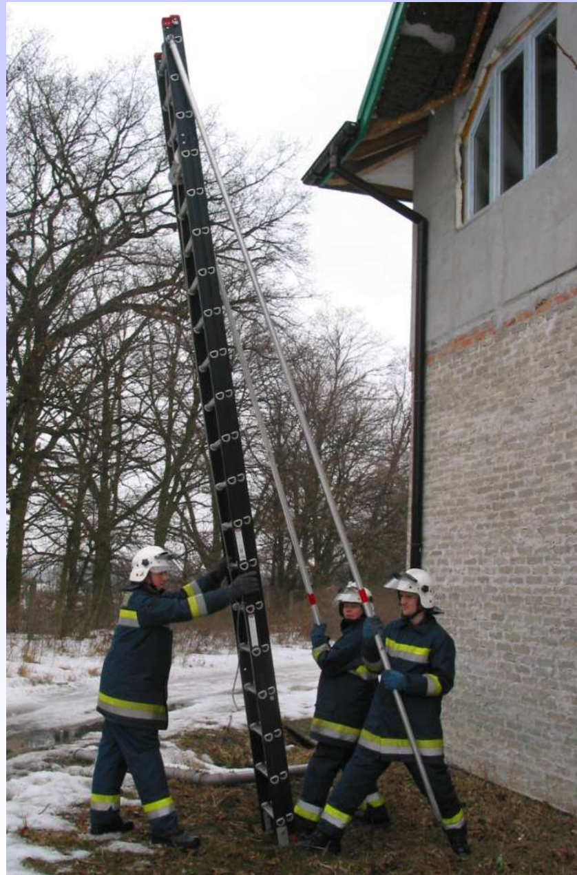
Pozycja przed oparciem drabiny o ścianę