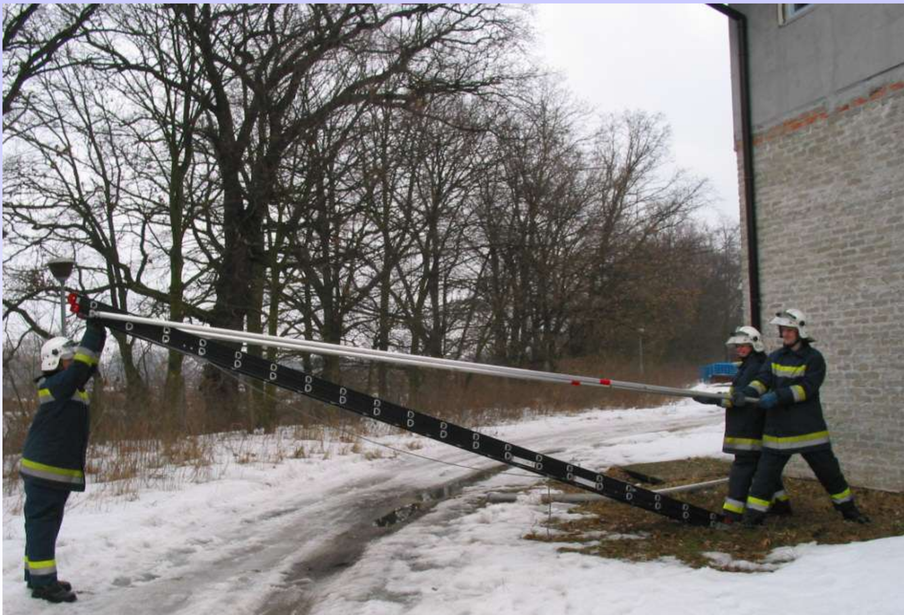
Podnoszenie drabiny do pozycji pionowej.