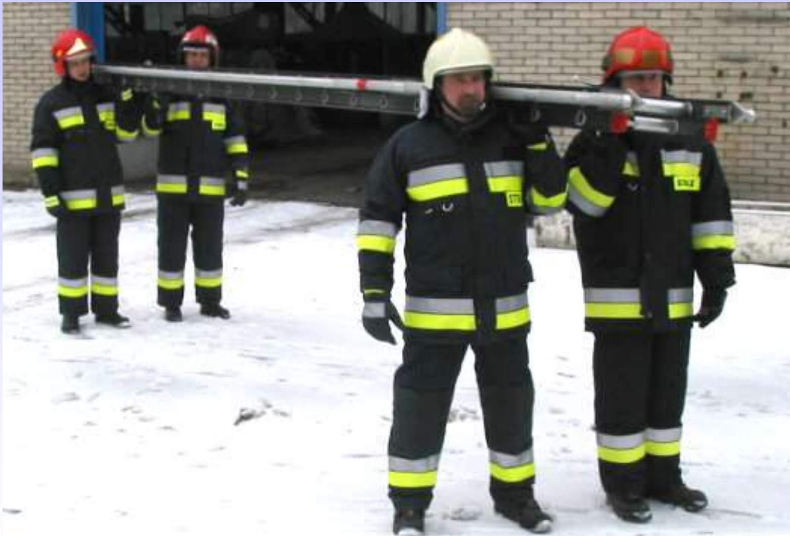
Transport drabiny na miejsce akcji