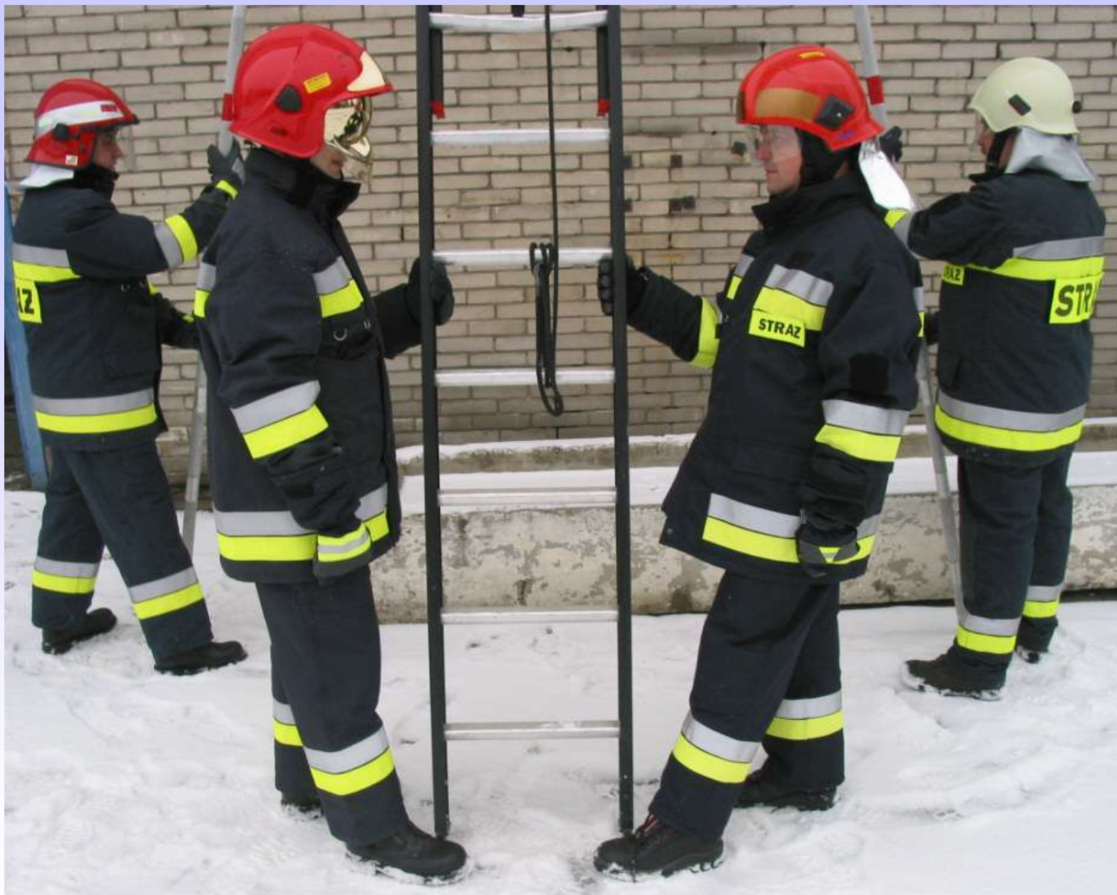
Asekuracja pracujących na drabinie.